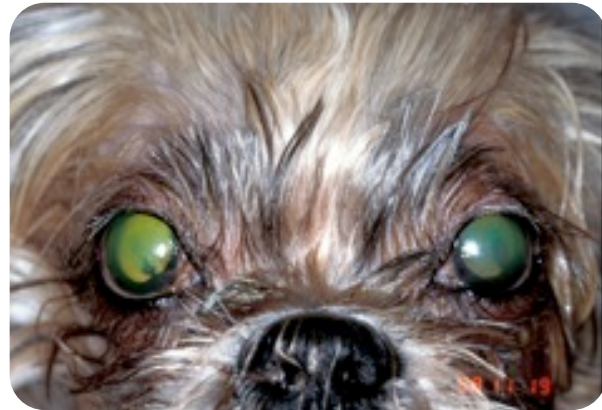
Cliché d'un yorkshire-terrier atteint d'une KCS légère : il s'agit d'une race prédisposée.

Ces changements peuvent conduire à une perte de la vision (cécité). Les paupières et la membrane nictitante (volet de conjonctive dans l'angle médial de l'œil) sont comme des « essuie-glaces » pour étaler les larmes sur la surface de la cornée et pour garder celle-ci propre. Les larmes sont ensuite drainées vers les points lacrymaux et les canaux lacrymaux qui aboutissent dans le nez comme chez l'homme. La production ainsi que l'étalement des larmes sont donc nécessaires au maintien d'une cornée saine et transparente.