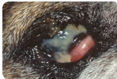
Quatre clichés de chiens atteints de KCS de façon plus ou moins sévère.