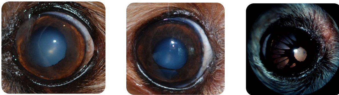
Trois cas d'atrophie de l'iris chez le chien : du plus modéré, au plus sévère.