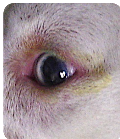
Blépharite dys-immunitaire chez un chien.