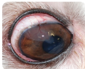
Deux exemples d'ENG