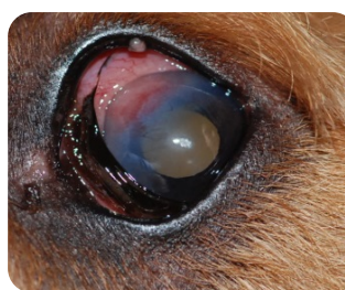
Aspect initial avec une ENG