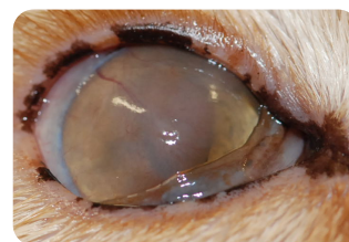
Le même œil, 8 semaines plus tard