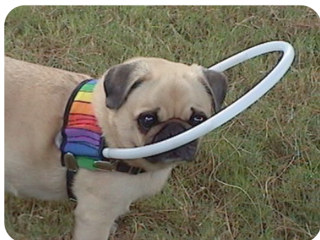
Système de protection pour chien aveugle

Après la perte de la vision chez votre animal, il y a une période d'adaptation et d'ajustement où vous devrez suivre plusieurs consignes afin qu'il demeure en sécurité. Les animaux aveugles vont utiliser leurs autres sens (l'ouïe, l'odorat, le toucher), ce qui rendra la perte de la vision bien moins traumatique que chez l'homme. En général, les animaux s'adaptent très bien surtout si la perte de vision fut progressive.