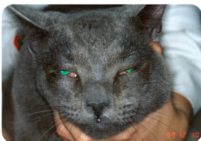
Entropion des 2 yeux sur un chat