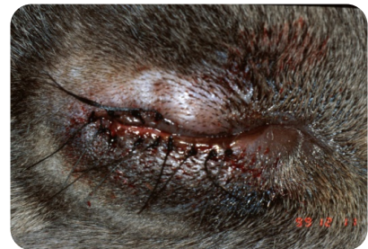
Même œil juste après la chirurgie