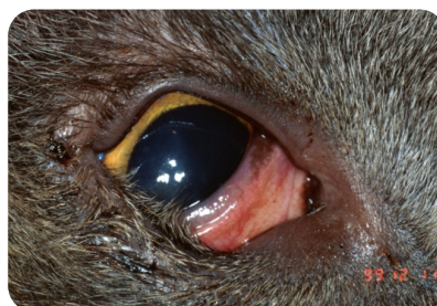
Détails de l'entropion sur un œil du même chat (œil droit)