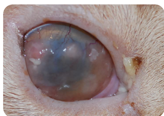
Un autre chat atteint de la même maladie