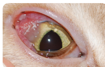
Détails du même œil