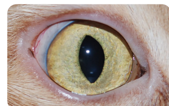
Le même œil après 4 semaines de traitement