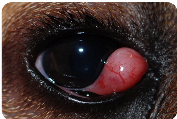
Luxation de la glande de la membrane nictitante

Important ! Vous devez savoir que le syndrome œil sec peut arriver même après la chirurgie à cause du traumatisme plus ou moins important de la glande lors de la luxation. Cette affection aussi est communément associée à un dysfonctionnement du système immunitaire; son apparition n'est pas prévisible et ne peut pas être traitée préventivement